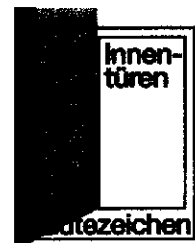
Der Vorsitzende der Gütegemeinschaft

Gütegemeinschaft Innentüren aus Holz und Holzwerkstoffen e.V. Ursulum 18 D-35396 Gießen